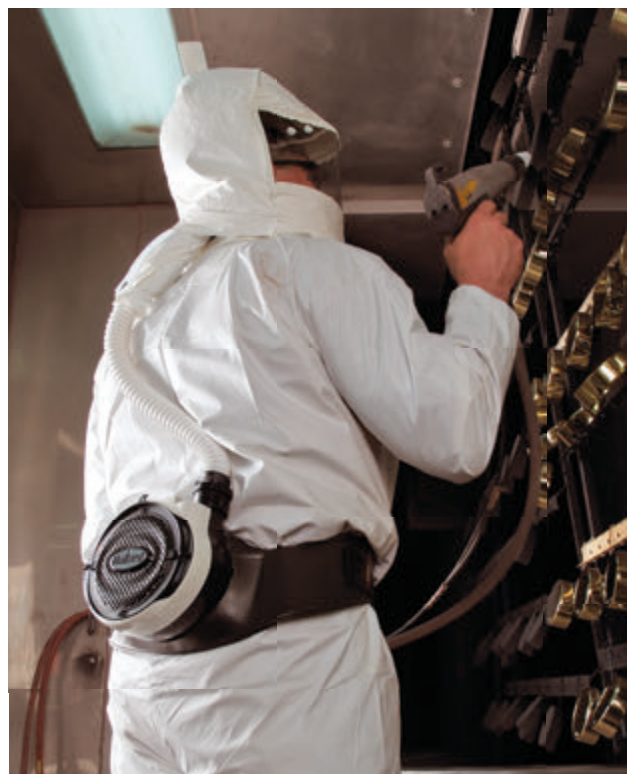
EVA供气量 优于竞争对手

EVA配备电量表，简易清楚，可帮助使用者迅速检查电池状态。风机的无刷马达，使用寿命长达10,000小时，耐用可靠。