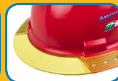
Teinte jaune pour éviter l'éblouissement