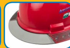
Teinte grise pour créer de l'ombrage