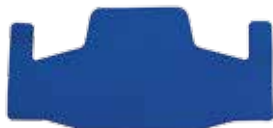
Almohadillado para la frente RBPCOOL