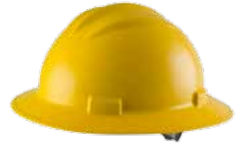
S71 (ala completa)